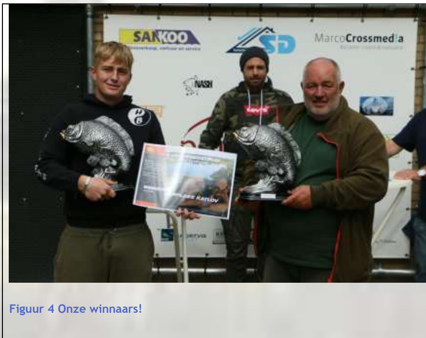
Figuur 4 Onze winnaars!

Net zoals als voorgaand jaar werd ook een eigen karper weekend georganiseerd. Voor de tweede maal over een periode van 3 dagen. Het aantal prijzen waren ook aangepast en de kosten voor de inschrijving waren omhoog gegaan. Dit om de dubbele kosten die moesten worden gemaakt ivm 2 maal warm eten af te dekken. Het totale weekend was een succes en de deelnemers waren enthousiast.