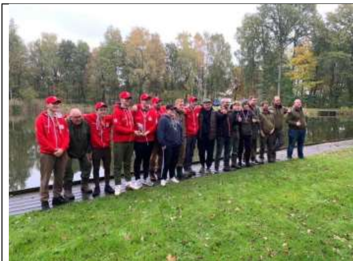
Figuur 7 Impressie van Internationale Samenwerking

Ook hebben we op het laatst nog een onderlinge krachtmeting gehad tussen de internationale jeugd! Helaas was de vangst een beetje tegenvallend, maar wel enkele goede vriendschappen bestendigd als voorbereiding op het Europees Jeugd Kampioenschap te Tsjechië.