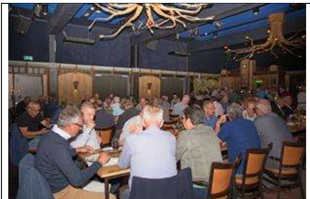
Figuur 2 Algemene Ledenvergadering van Sportvisserij Zuidwest Nederland

Het bestuur heeft in 2019 weer enkele regio-bijeenkomsten/ALV van Sportvisserij Zuidwest Nederland bezocht.