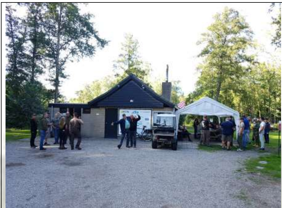
Figuur 3 Vrijwilligers tijdens de organisatie van wedstrijden

Momenteel telt ons bestand een aantal van 1056 leden.