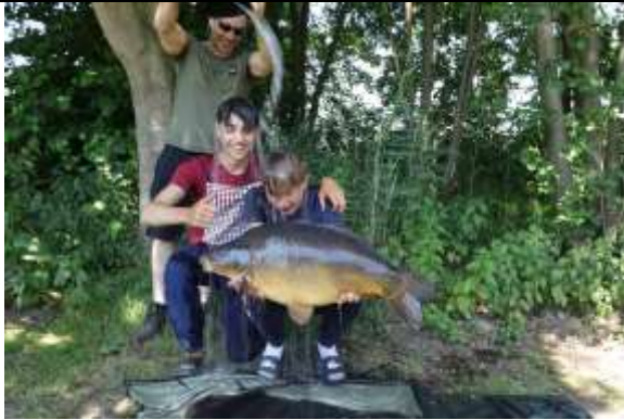
Figuur 5 De winnaars voor Nederland