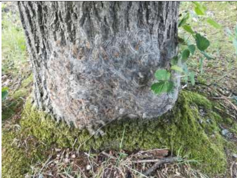
Figuur 11 processierupsen