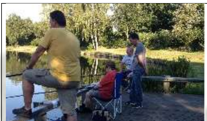
Figuur 10 impressie Lunetzorg vissen

Zoals ieder jaar werd door de Philips Hengelsportvereniging weer de gelegenheid geboden aan Lunetzorg om te vissen met cliënten. Een kleine momentje waarop men kan ontspannen, kan genieten van de omgeving en vooral het vangen van vis. Het bestuur heeft bewondering voor de vrijwilligers welke tijdens deze activiteit het geduld op kunnen brengen en hen de tijd van hun leven geven.