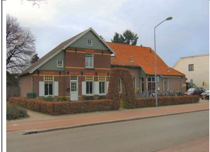
Figuur 1 D'n Oude School te Oerle

Op 31 januari 2019 vond de Algemene Ledenvergadering van Philips Hengelsportvereniging over het jaar 2018 plaats in D'n Oude School te Oerle. Inmiddels een vertrouwde locatie voor de ALV van onze vereniging. Deze ALV werd bezocht door 66 leden van onze vereniging.