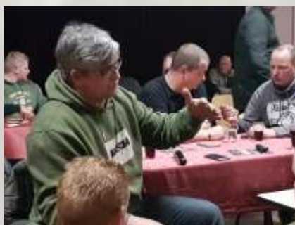
Figuur 8 Impressie van de thema-avond

Het is al vele jaren geleden dat het bestuur voor het gehele jaar de vijver had vrijgegeven voor de nachtvisserij. Recapitulerend voor 2019 is het redelijk goed verlopen en hebben zich geen noemenswaardige en onoplosbare problemen voorgedaan aan de waterkant. Daarom is afgelopen jaar is er wederom geen evaluatieavond meer geweest. Neemt niet weg dat we altijd geïnteresseerd zijn in uw mening en daarvoor hoeft u niet te wachten tot de ALV. U kunt ons altijd bereiken via de bekende emailadressen of ons aanspreken op de vijver. Dit geldt voor alle commissieleden en alle leden van het bestuur. Ook vanuit uw reacties op topics op FB nemen wij uw opmerkingen mee in onze periodieke vergaderingen.