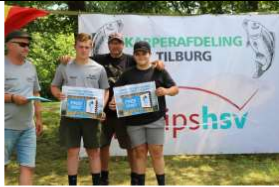
Figuur 6 De winnaars voor België